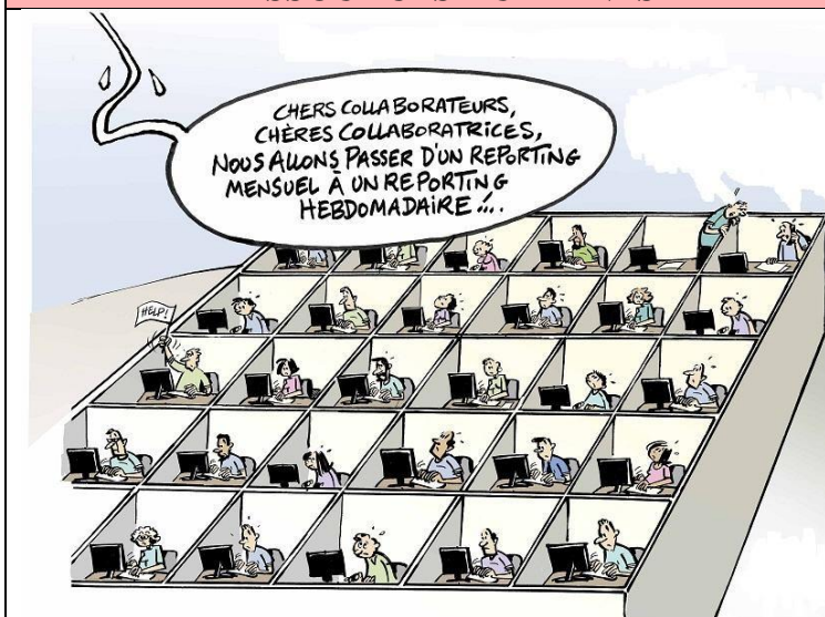
CONDITIONS DE TRAVAIL