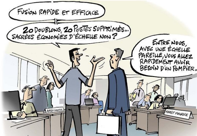
PROJETS DE REORGANISATION